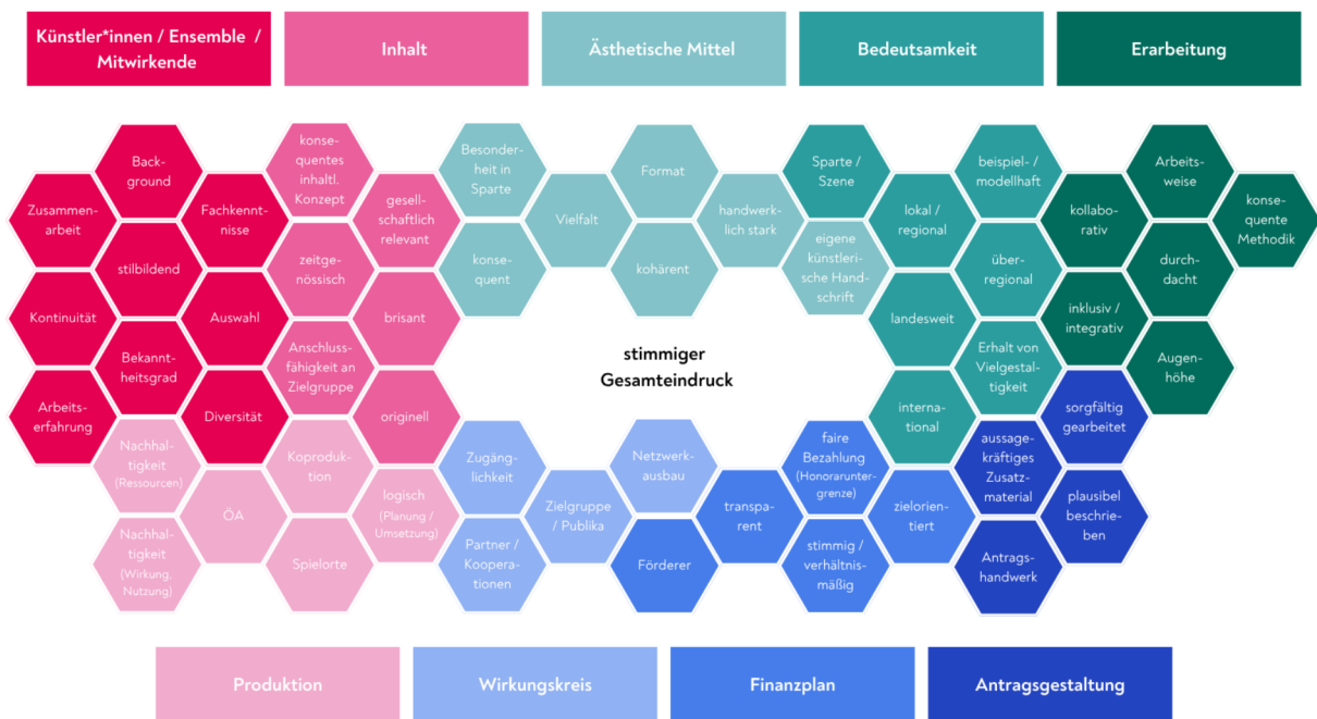
© NRW Landesbüro Freie Darstellende Künste e.V., 2026